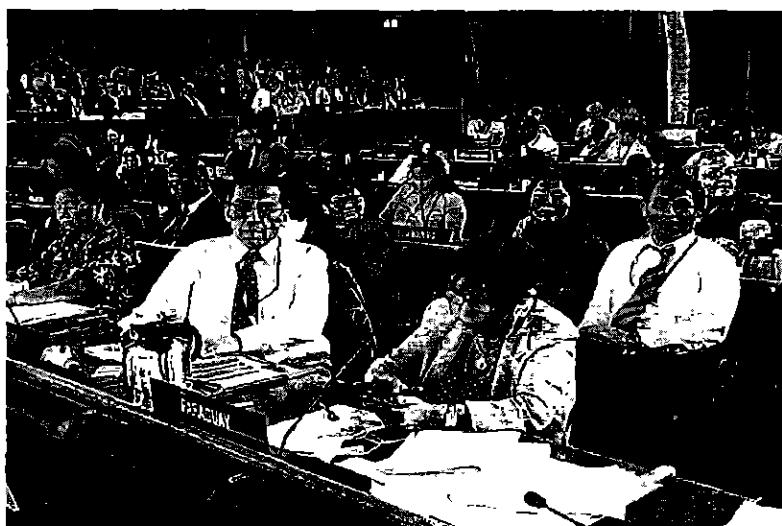
Figura 1: Delegados de Perú en el CAC 41

La sesión se realizó de acuerdo a la siguiente agenda propuesta: